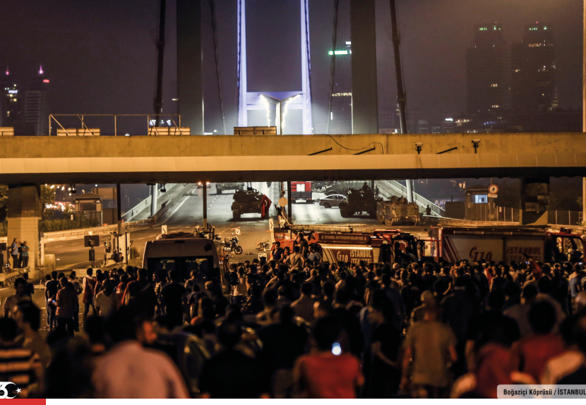
Boğaziçi Köprüsü / İSTANBUL