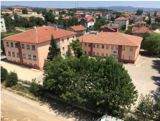
Okulumuzun Eski Hali